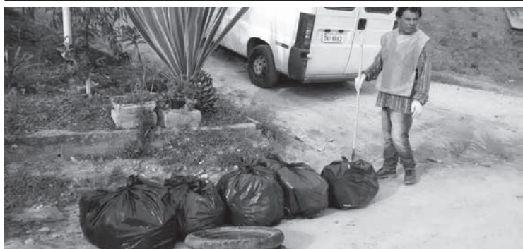
Mutirão contra o Mosquito da Dengue foi iniciativa dos moradores do Bairro Nova Serra Negra e Secretaria Municipal da Saúde!

O Conselho Municipal de Turismo de Serra Negra é o gestor de políticas públicas desse segmento e canal efetivo de participação que permite estabelecer a aproximação do Poder Público com a sociedade civil. Seu papel é de fortalecimento da participação democrática da população na formulação e implementação dessas políticas públicas.