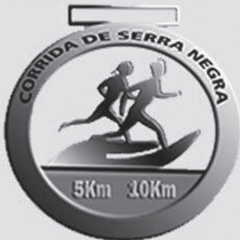
Imagem somente para efeito de ilustração.

... mas quando a corrida é beneficente, faz bem para a alma, também.