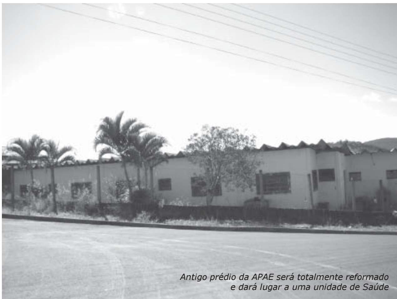
Antigo prédio da APAE será totalmente reformado e dará lugar a uma unidade de Saúde