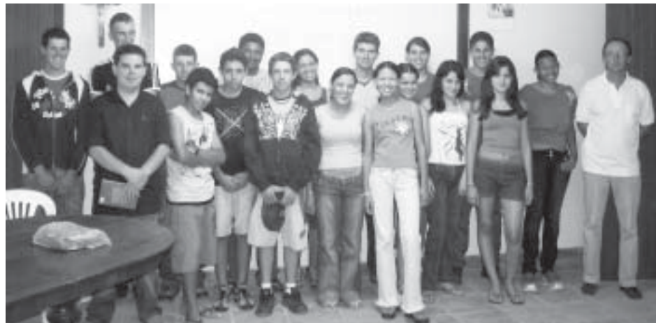
Jovens dos Leais que estão trabalhando na implantação da biblioteca

Uma Biblioteca no bairro dos Leais iniciará suas atividades no começo do mês de novembro. O grupo de jovens do bairro já está movimentando toda a comunida-de a fim de adequar o Salão Co-munitário como sede provisória.