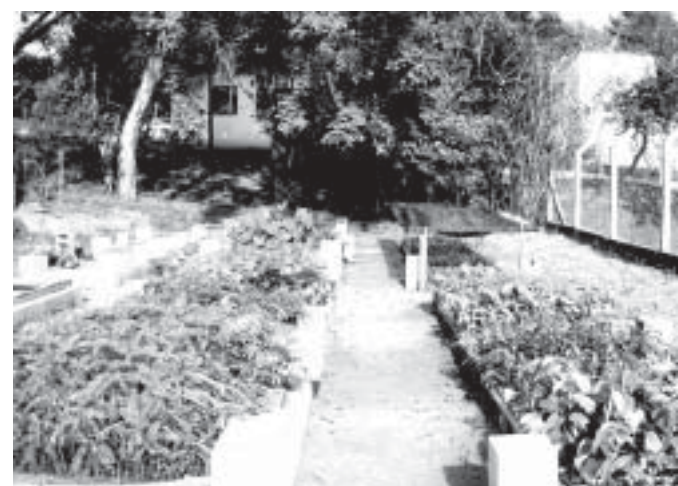
Viveiro Público mantido pela SEMADU

A luta para a preservação do meio ambiente deve ser diária e necessariamente precisa contar com a participação de todos: poder público e população, ou então a saúde e qualidade de vida das próximas gerações ficarão comprometidas. Reflexão: 'Para que amanhã