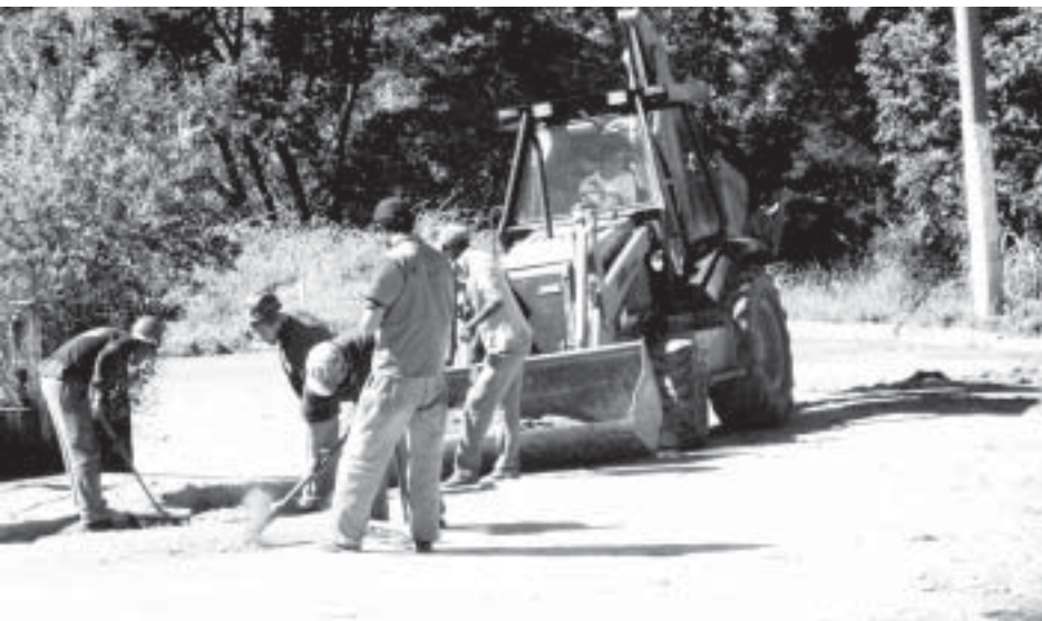
Rua Marcos Ducceschi