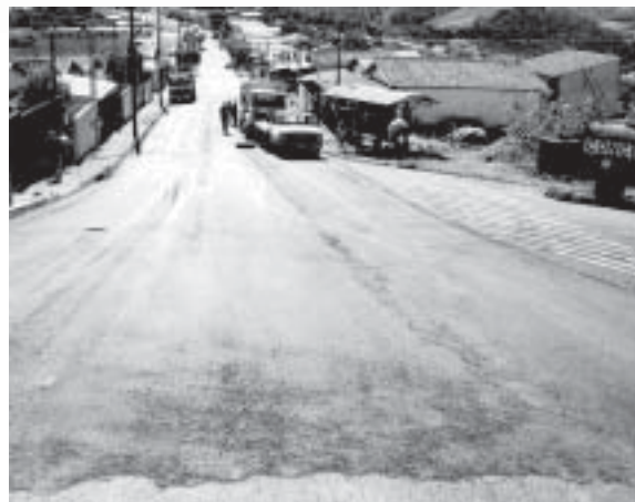
Rua Ver. Dirceu Tomazeli Guidetti

A Prefeitura está executando recapeamento e operação 'tapa buraco' em toda a cidade e providenciando a manutenção das estradas de terra dos loteamentos e bairros.