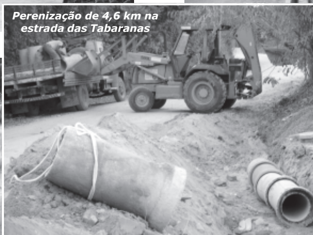
Perenização de 4,6 km na estrada das Tabaranas