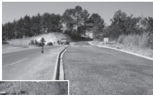
Rotatória - Bairro da Serra