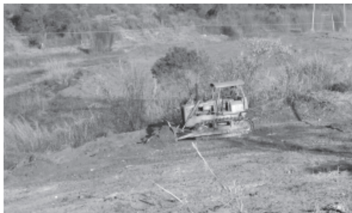
Início das obras do Parque Ecológico Santa Lídia