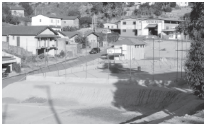
Praça Esportiva - Refúgio da Serra