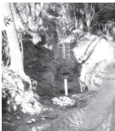
Muro de arrimo - Residencial das Posses