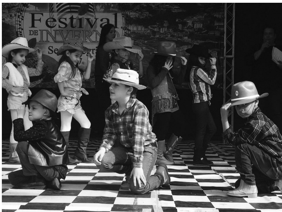
Tão logo será divulgada a programação das danças de quadrilha das Escolas Municipais.

A arrecadação será revertida para a Associação de Pais e Mestres, APM das escolas e para as próprias entidades assistenciais.