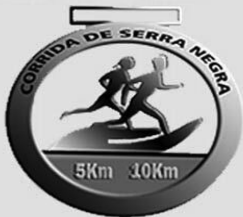
Imagem somente para efeito de ilustração.

... mas quando a corrida é beneficente, faz bem para a alma, também.