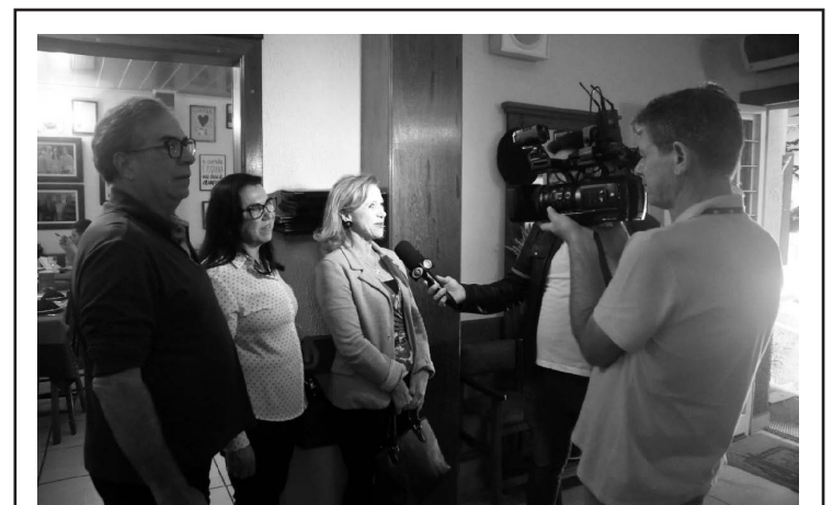
Turismo de Serra Negra será destaque em matéria da Band no início de janeiro. Nós avisaremos aqui para você não perder a matéria!