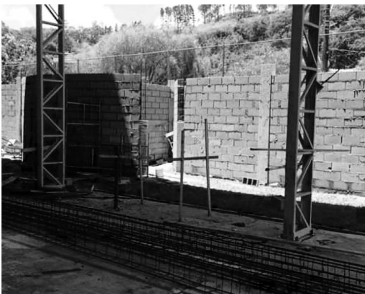
Obras da construção do vestiário no Campo do Sete seguem a todo vapor! Esporte é saúde!