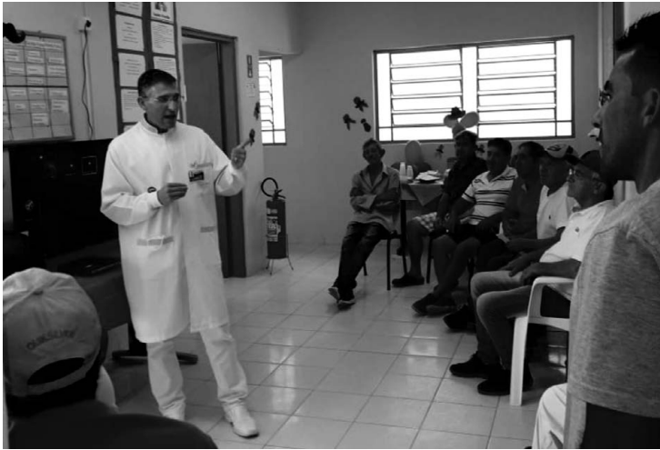
Novembro Azul na Unidade de Saúde da Família das Três Barras. Prevenção de câncer próstata e avaliação da Saúde