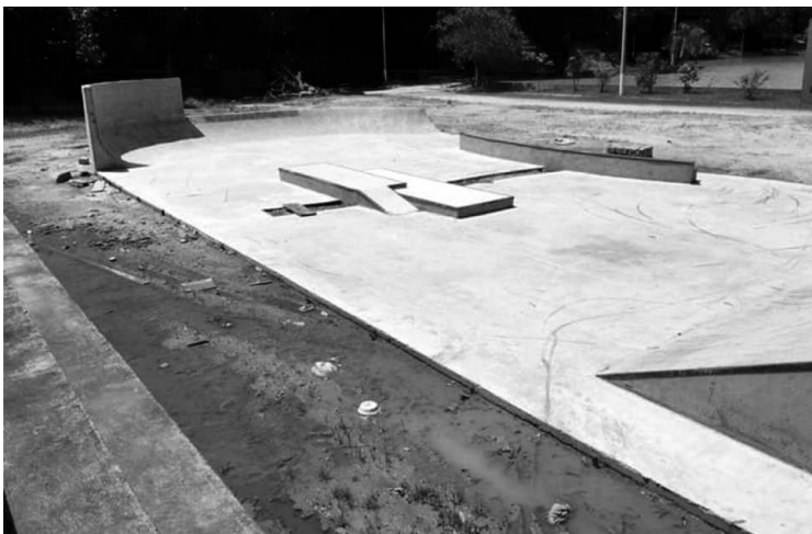
Obras da mais nova pista de Skate no Parque Represa Dr. Jovino Silveira - conhecido como Parque da Barragem - seguem a todo vapor! Esporte é Saúde!